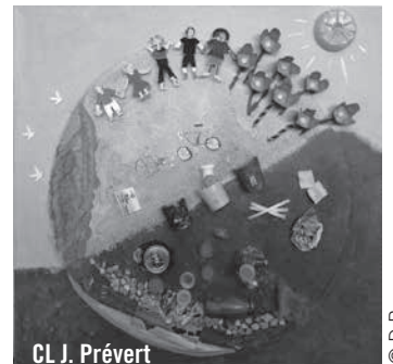
CL J. Prévert