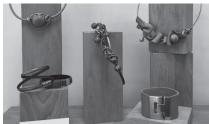
Illustration : Laure Boussion (Hermine de Crayon)

Peinture sur porcelaine : Marie Claude Boulanger (Porcelaine designer)